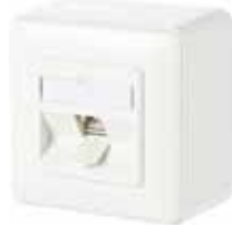
Exempel på bredbandsuttag för kopparnät (UTP)

I bostäder med ett vanligt bredbandsuttag (se bild) finns en uppsjö av lösningar för att ansluta olika tjänster. Här listar vi tre alternativ , beroende på hur du vill använda bredbandet tillsammans med de tjänster vi erbjuder.